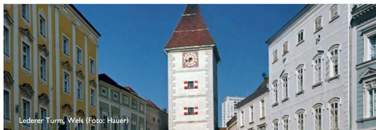
Lederer Turm, Wels

Die Antworten finden Sie im Kleinanzeiger.